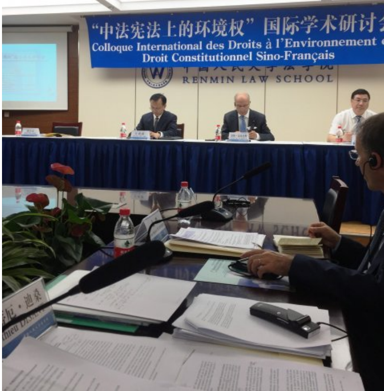
Colloque franco-chinois de droit constitutionnel