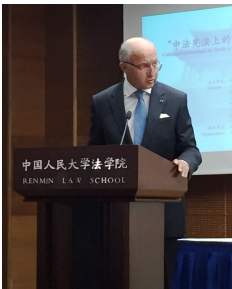
Colloque franco-chinois de droit constitutionnel

Le Président Fabius s'est également entretenu avec le Président de la Cour populaire suprême de la République populaire de Chine, M. ZHOU Qiang, ainsi qu'avec le Vice-Président de la République, M. LI Yuanchao, et le Négociateur en chef sur les questions climatiques, M. XIE Zhenhua.